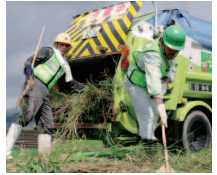
刈り取った草を収集車に

建設業協会ではこの度ネーム入りのベストを導入し、県内各支部に1、800枚を配布しました。これは「災害対応の際などに、見物者が被害者か作業者か見分けがつかず、警察から止められたりすることがある」といった声に応えたものです。作業者であることを目立たせるよう緑の蛍光色で、