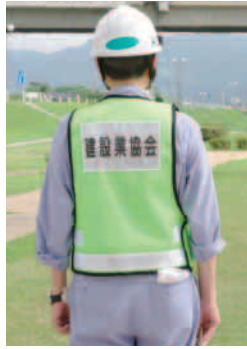
背中にネームの入ったベスト

建設業協会ではこの度ネーム入りのベストを導入し、県内各支部に1、800枚を配布しました。これは「災害対応の際などに、見物者が被害者か作業者か見分けがつかず、警察から止められたりすることがある」といった声に応えたものです。作業者であることを目立たせるよう緑の蛍光色で、