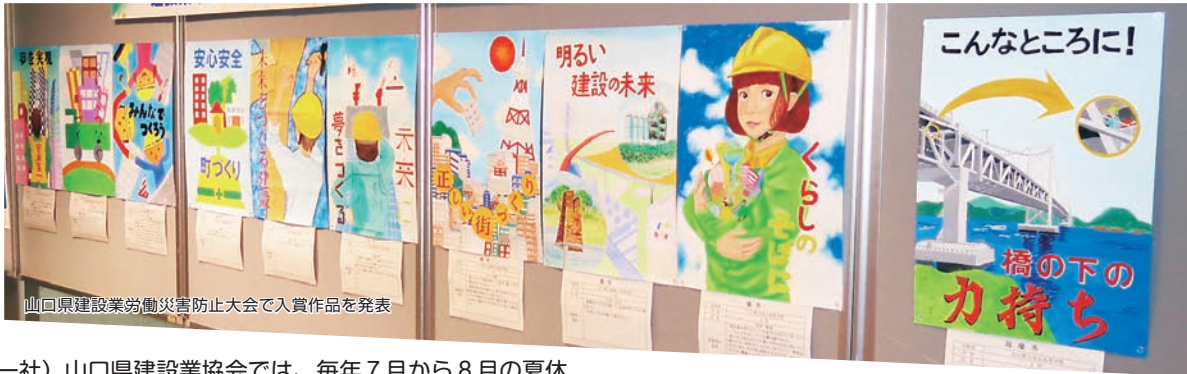
山口県建設業労働災害防止大会で入賞作品を発表

(一社)山口県建設業協会では、毎年7月から8月の夏休みにかけて、建設産業界の発展・振興及び建設業のイメージアップを図るため、「魅力ある建設業、希望あふれる建設業、将来の夢」を託したイメージアップポスターを県内の高等学校の生徒から広く募集しております。